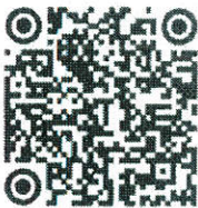
QR Code สำหรับ ดาวน์โหลดเอกสาร

(นายสุทธิพงษ์ จุลเจริญ) ปลัดกระทรวงมหาดไทย