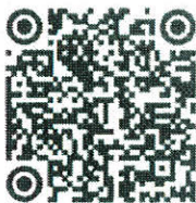
QR Code สำหรับ ดาวน์โหลดเอกสาร

(นายสุทธิพงษ์ จุลเจริญ) ปลัดกระทรวงมหาดไทย