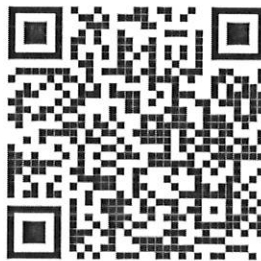
คู่มือ Admin หน่วยบริการ