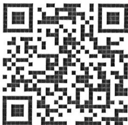
สรุปขั้นตอน

ขอขอบคุณที่ให้ความร่วมมือในการบูรณาการเพื่อขับเคลื่อนมาตรการความโปร่งใสในครั้งนี้ เป็นอย่างดี