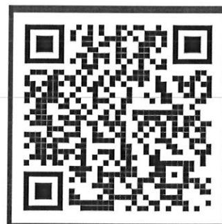
คู่มือการใช้งาน LINE OA “PACC Feedback Support”