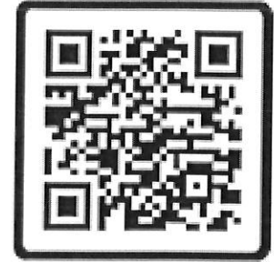
การลงทะเบียน การใช้งานระบบ Feedback

ทั้งนี้ หากพบข้อขัดข้อง ปัญหาอุปสรรค หรือประสงค์จะสอบถามข้อมูลเพิ่มเติม ให้แจ้งข้อมูลผ่าน LINE OA เพื่อให้ทีมงาน PACC Feedback Support ช่วยเหลือหรือสนับสนุนข้อมูล และแก้ไขปัญหาการใช้งานระบบ Feedback รายละเอียดตาม QR Code