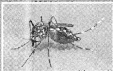
ความรู้เรื่องโรคติดต่อนำโดยยุงลาย