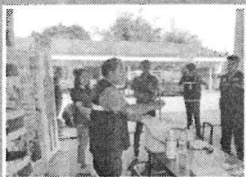
เทคนิคการฟั่นสารเคมี ความรู้เรื่องสารเคมีและการใช้สารเคมีกำจัดยุงลาย