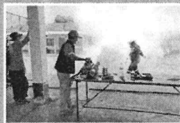
หลักการประเมินประสิทธิภาพเครื่องฟั่นทางสาธารณสุข