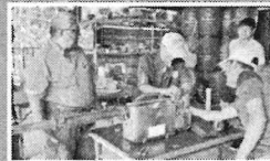
หลักการทํางานและการซ่อมบำรุงเครื่องฟั่นหมอกควัน