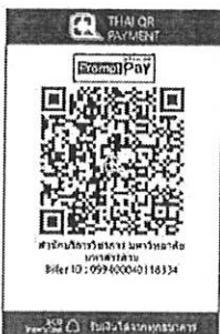
สแกน QR Code เพื่อชำระค่าลงทะเบียน